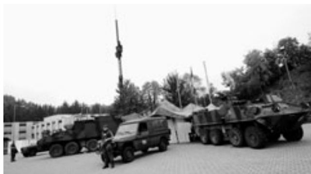
Militärische Führungsausbildung: Unter schwierigsten Bedingungen planen und führen können.

Grundlage bildet eine im Jahr 2008 durchgeführte Befragung bei einem Infanteriebataillon der Schweizer Armee. Die Daten wurden im Rahmen eines Wiederholungskurses erhoben und anschliessend elektronisch erfasst. Für die Auswertung standen die Antworten von 380 Bataillonsangehörigen (Soldaten, Unteroffiziere und Offiziere) zur Verfügung. Es werden zwei Populationen unterschieden: einerseits Soldaten und andererseits militärische Kader, also Offiziere und Unteroffiziere. Kader unterscheiden sich von den Soldaten dadurch, dass sie zusätzlich zur Grundausbildung eine militärische Weiterbildung absolviert haben. Die Kernfrage «Haben Personen mit einer militärischen Weiterbildung beruflich einen Vorteil oder einen Nachteil?» wird quantitativ und qualitativ beantwortet. Einerseits wird eine Regressionsanalyse auf Basis der soziodemografischen und berufsspezifischen Informationen durchgeführt. Das verwendete Regressionsmodell basiert auf einer Mincer-Lohnleichung (Mincer, 1974), welche mit Variablen zur Kaderposition, Branche, Unternehmensgrösse, Berufserfahrung sowie mit Angaben zur zivilen Weiterbildung und mit soziodemografischen Merkmalen der Personen ergänzt wurde. Da die Lohninformation nur in Lohngruppen zur Verfügung stand, wird