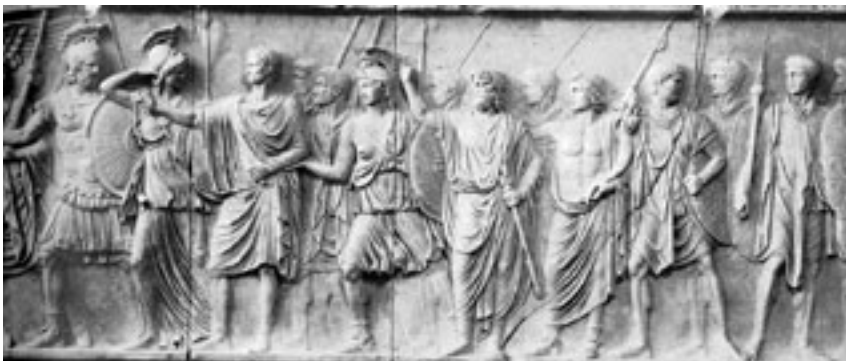
Ungeahnte Folgen durch Heeresreform: Römische Legionäre, Bürger und Gottheiten auf dem Cancelleria-Relief, Rom, ca. 90 n.Chr.

Im 20. Jahrhundert stiegen viele grosse westliche Staaten nach dem Zweiten Weltkrieg wieder