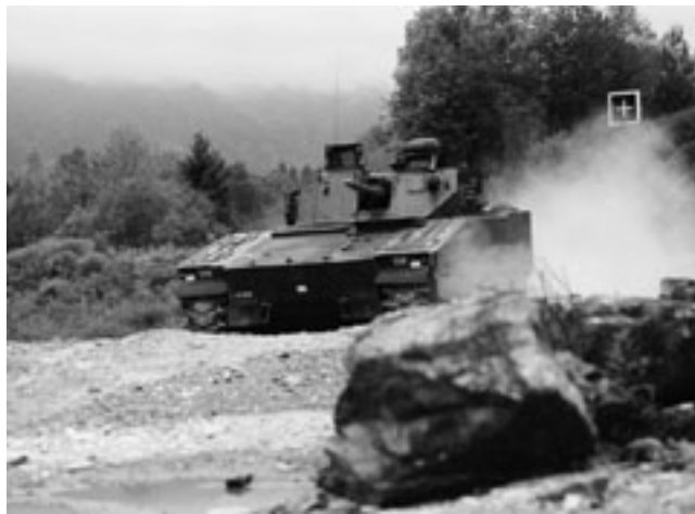
Schützenpanzer 2000: Schutz, Mobilität und Waffenwirkung sind die Prämissen für unsere Milizsoldaten.

Nur mit den drei Prämissen «bessere Führung und Planung», «mehr Kompetenz und Eigenverantwortung für die Miliz» und «mehr Mittel» lässt sich die riesige Herausforderung, vor der die Sicherheitspolitik und die Armee stehen, überhaupt bewältigen.