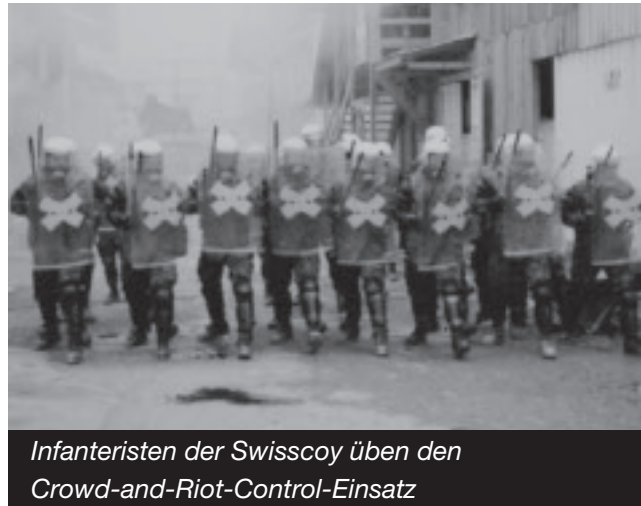
Infanteristen der Swisscoy üben den Crowd-and-Riot-Control-Einsatz

Konfrontiert mit solchen Fragen ist im engeren Sinn der Planungsstab der Armee, der auch regelmässig dafür Prügel bezieht, innerhalb und ausserhalb der Armee.